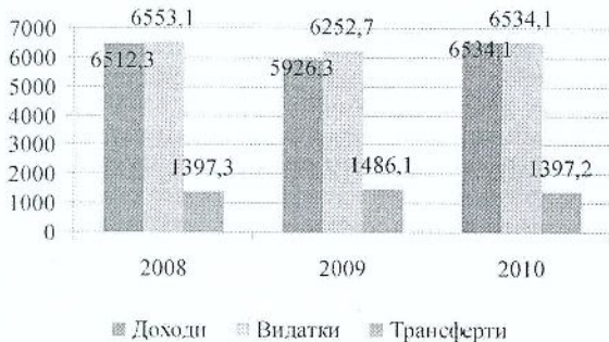
Рисунок 2. Аналіз доходів, витрат і трансфертів консолідованих бюджетів Росії протягом 2008-2010 рр. млн. руб.

чить про зрівноважування дохідної та видаткової частин місцевих бюджетів. Згідно рисунку 1 можна зробити висновок, що витрати мають циклічний характер, і зменшилися в 2010 році по відношенню до 2008 року на 33,8% у той час як доходи за відповідний період зросли на 16%. Щодо обсягу трансфертів, які передаються з державного бюджету до місцевих, то слід зазначити, що їх питома вага в доходах збільшилася на 24%.