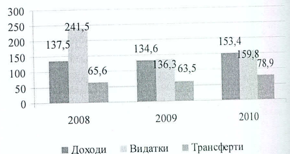
Рисунок 1. Аналіз доходів, витрат і трансфертів місцевих бюджетів України протягом 2008-2010 рр. м.лн. грн.

Проаналізуємо обсяг доходів і видатків місцевих бюджетів протягом 2008-2010 рр. для визначення забезпеченості місцевих бюджетів власними ресурсами (рис. 1).